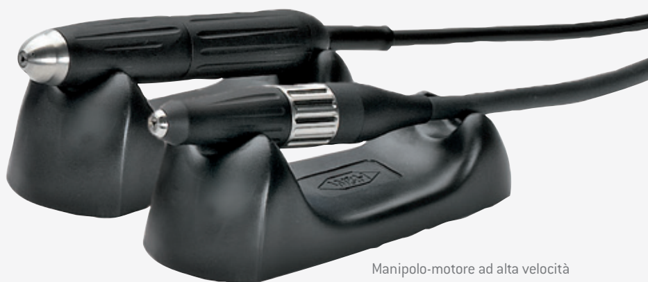
Manipolo-motore ad alta velocità