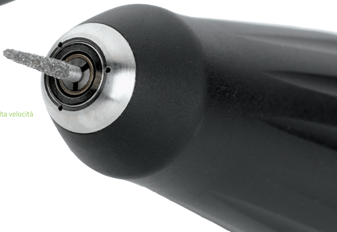
Manipolo-motore ad alta velocità