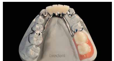
Lavoro sul modello