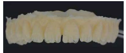
top.lign professional in fase di lavorazione