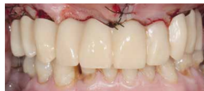
Lavoro in situ