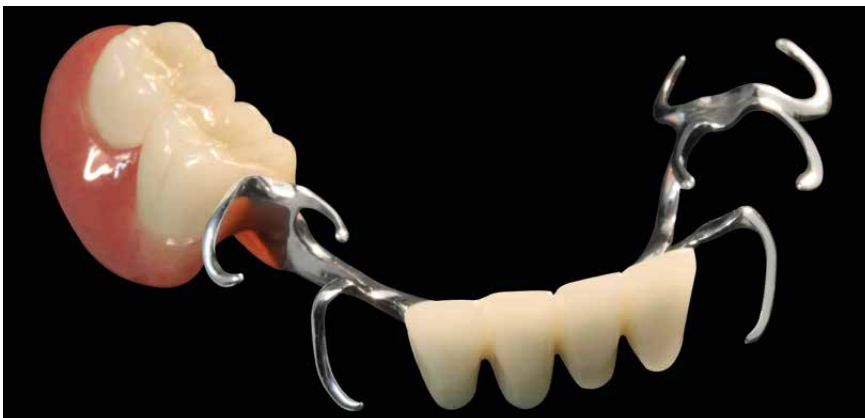
Protesi scheletrica con ganci in abbinamento con top.lign professional e faccette estetiche novo.lign