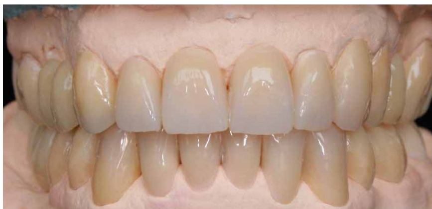
Provvisorio realizzato in top.lign professional