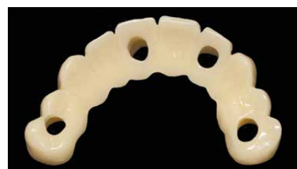
Lavoro rifinito e lucidato