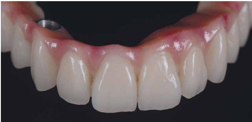
Protesi definitiva avvitata su impianti in top.lign professional, con finta gengiva in crea.lign