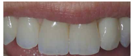
Lavoro ultimato in situ