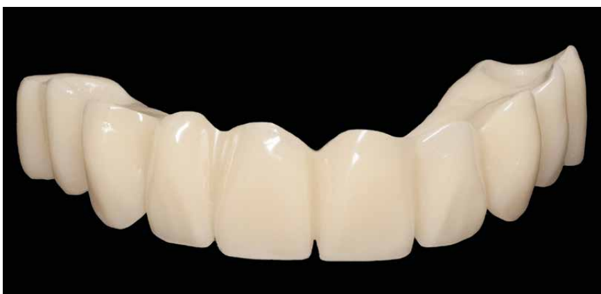
Protesi a carico immediato in top.lign professional senza struttura di supporto