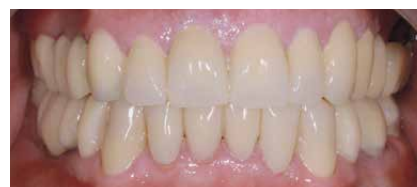
Lavoro in situ